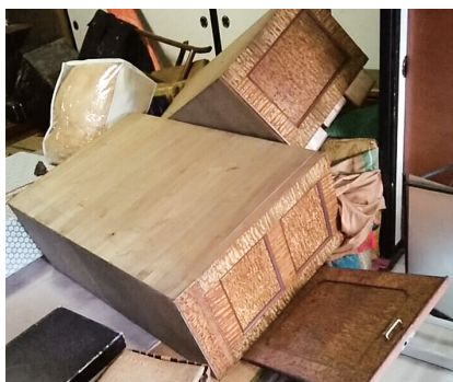
(平成30年北海道胆振東部地震の室内被害の状況)

地震で家具類が転倒・落下・移動すると、ケガ、火災、避難障害が発生する可能性があります！